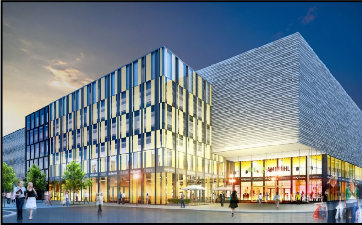
Visualisierung Grüntuch Architekten

Materialstärken 15mm, Befestigung auf Ankerdorntechnik